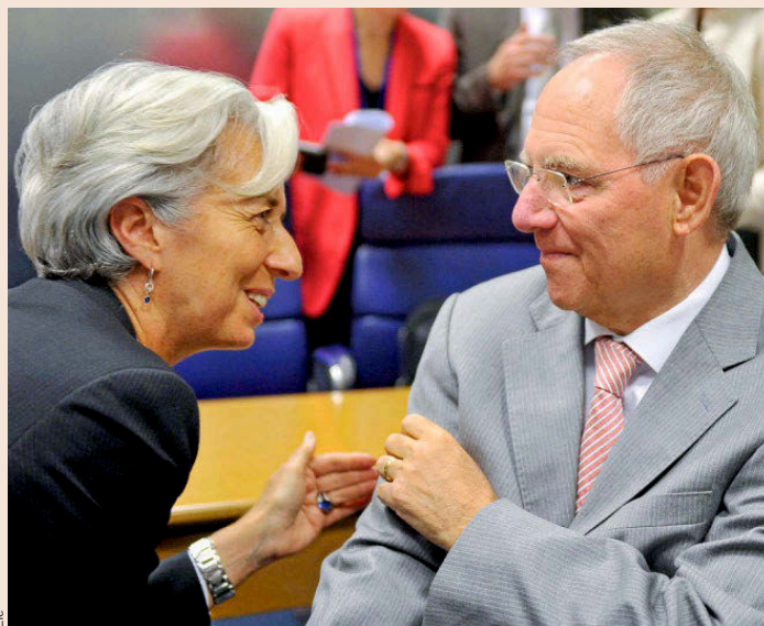
La directora gerente del FMI, Christine Lagarde, y el ministro de Finanzas alemán, Wolfgang Schäuble.

le abundar una cortesía diplomática extrema. Por eso, es posible que ninguno de los ministros allí convocados (así como los responsables de organismos multilaterales como la OCDE o el FMI) mencionen explícitamente el problema del proteccionismo, sobre todo cuando se trata de la primera cumbre del G20 a la que acude el secretario del Tesoro de EEUU, Steve Mnuchin. La reunión, además, coincide con el encuentro entre Trump y Merkel, que hoy se reunirán por primera vez en la Casa Blanca. Elefante en la habitación Es decir, que la política comercial estadounidense en principio no estará formalmente en el orden del día aunque sea el tema que más preocupe a los asistentes, como un elefante en la habitación del que nadie quiere hablar. “Existe la posibilidad de que excluyamos el tema del comercio en la reunión de Baden-Baden y dejemos que eso se aborde en la cumbre de jefes de Estado y Gobierno”, prevista para el 7 y 8 de julio en Hamburgo, aseguró ayer el ministro alemán de Finanzas, Wolfgang Schäuble. No obstante, el dirigente germano aclaró que pediría a Mnuchin que explique los planes de la Administración Trump para reducir el déficit