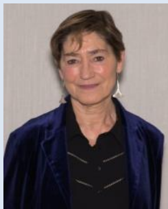
Consejo General de la Abogacía Española (CGAE)