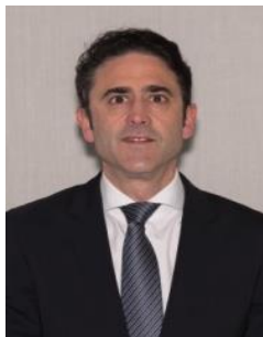
Consejo General de la Ingeniería Téc. Industrial (COGITI)