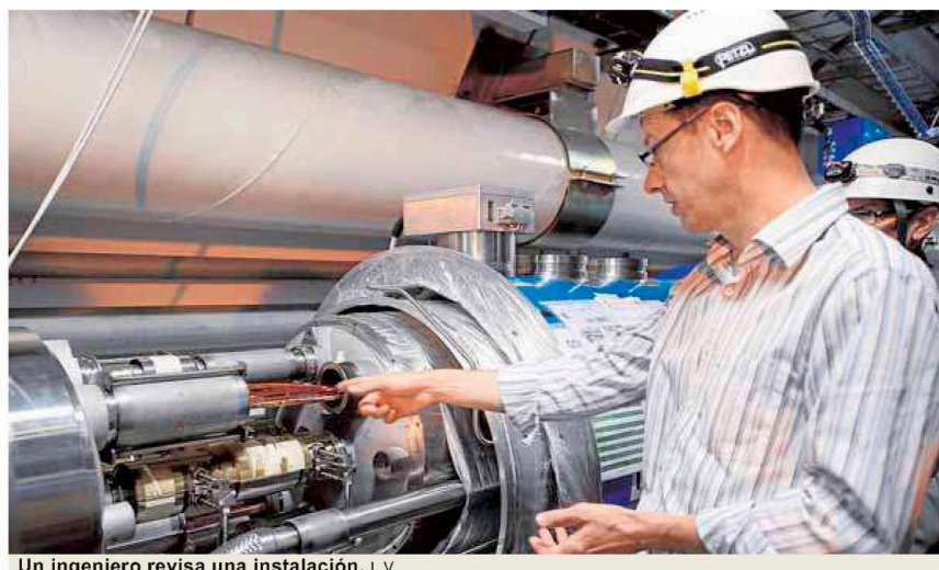
Un ingeniero revisa una instalación. L.V.

aportación a los parlamentarios de que el texto legislativo debería ser lo suficientemente amplio que permitiera el consenso de la totalidad de las profesiones colegiadas, al margen de que, posteriormente, cada profesión regulase, por medio de estatutos o reglamentos, aquellas cuestiones puntuales y específicas que les afectaran diferencialmente.