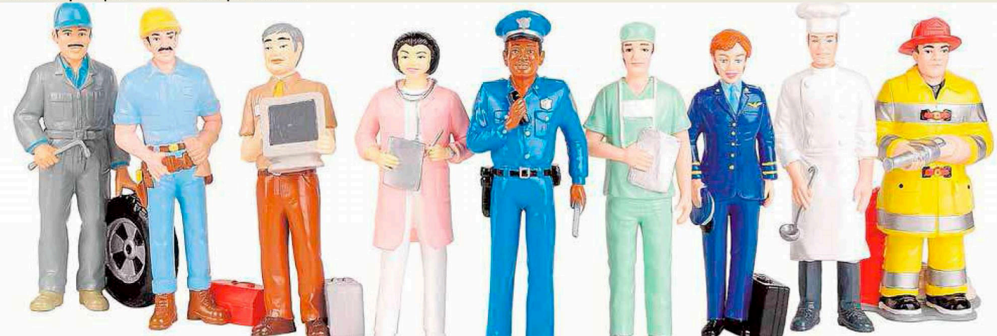
Muñecos que representan diversas profesiones. L.V.

UN FIN SOCIAL La práctica ética en el marco de la labor profesional constituye uno de los principios comunes que ayudan a definir los estatutos de cada corporación