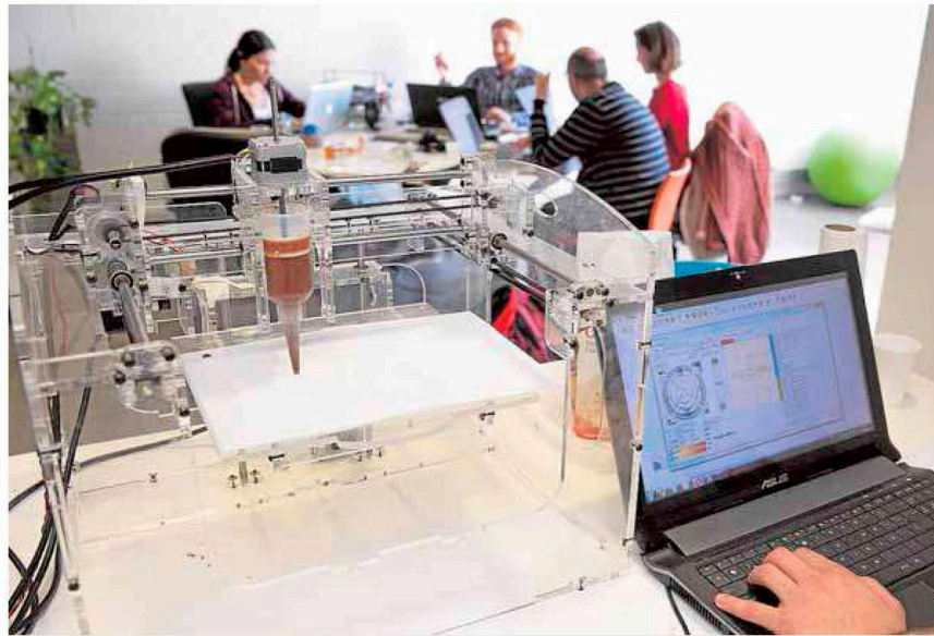
Reunión de trabajo entre profesionales. L.V.

En las primeras sesiones de trabajo se estudió la entonces futura Ley de Colegios Profesionales de la Comunidad Valenciana, con la