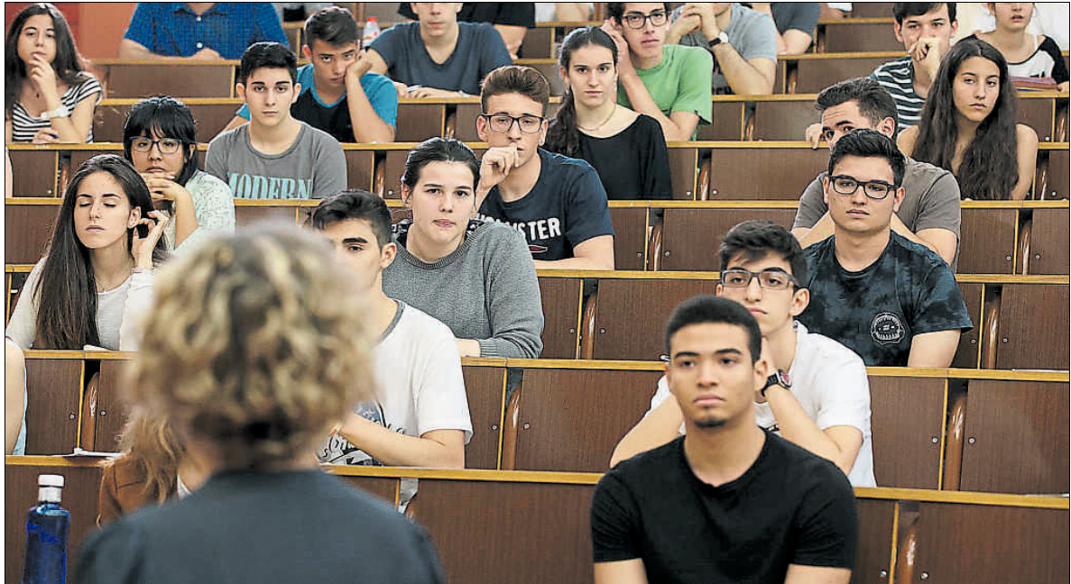
Jóvenes de bachillerato que se presentaron a las pruebas de acceso a la universidad del pasado mes de junio en la facultad de Biología

Según CC.OO. el personal interino formaba un colectivo de más de 560 personas