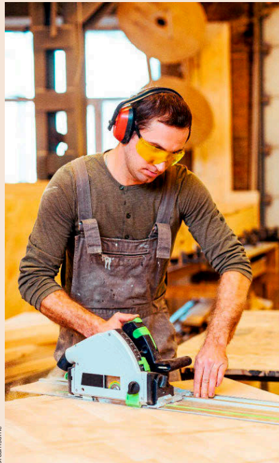
Los autónomos suman en España 3.2 millones de trabajadores.

• Más facilidades para el cambio de la base de cotización. Los empresarios/trabajadores