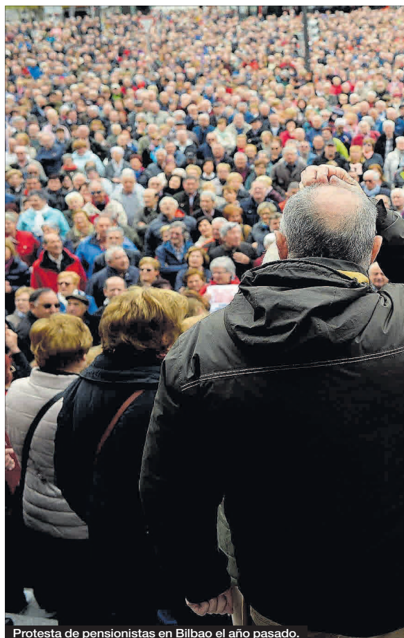
Protesta de pensionistas en Bilbao el año pasado.

La Seguridad Social tiene un déficit estructural de unos 17.000 millones de euros, ya que lo que se ingresa por cotizaciones no llega a cubrir el gasto en prestaciones. «Es preciso hacer un plan a cinco años que permita reorientar el transatlántico de la Seguridad Social y tenerlo saneado en el 2024 o 2025, cuando empiece a llegar a la jubilación