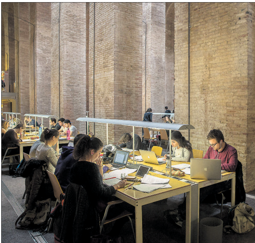
Una sala de estudios de la Universidad Pompeu Fabra (Barcelona), este marzo.